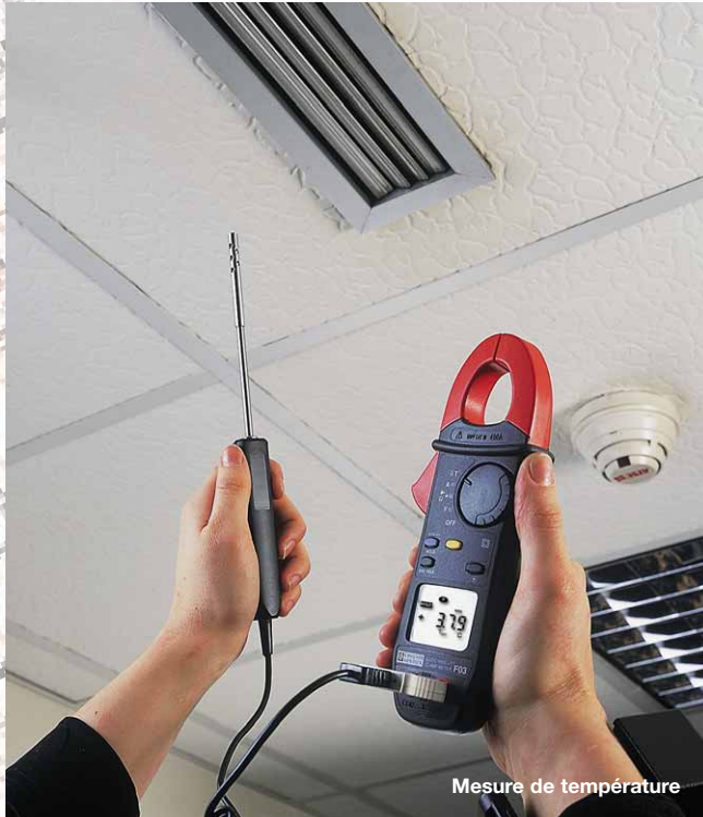
Mesure de température

Par l'ajout d'un simple capteur, la fonction Température des pinces F03 et F07, mesure comme ici la température ambiante, ou de surface, en °C ou en °F.