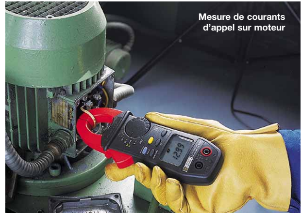
Mesure de courants d'appel sur moteur

Un fort appel de courant peut déclencher les systèmes de sécurité, voire endommager l'installation. La fonction "Inrush current" mesure l'évolution du courant de démarrage moteur, sans nécessité de visualisation graphique, et définit les relations amplitude-temps de la protection moteur.